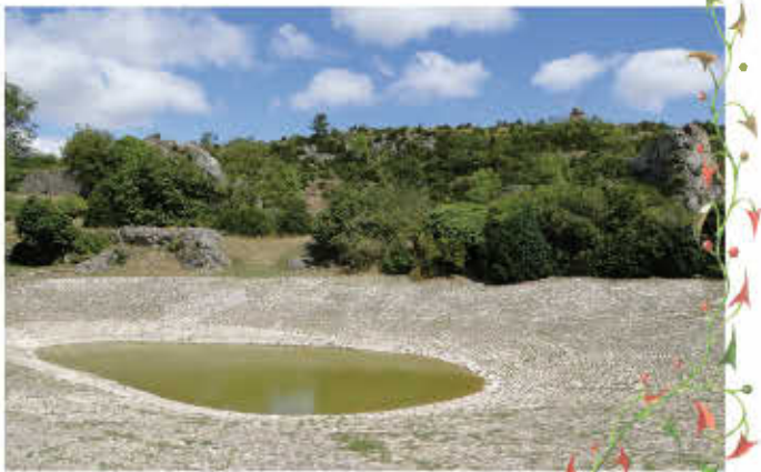
La lavogne au Sud du site