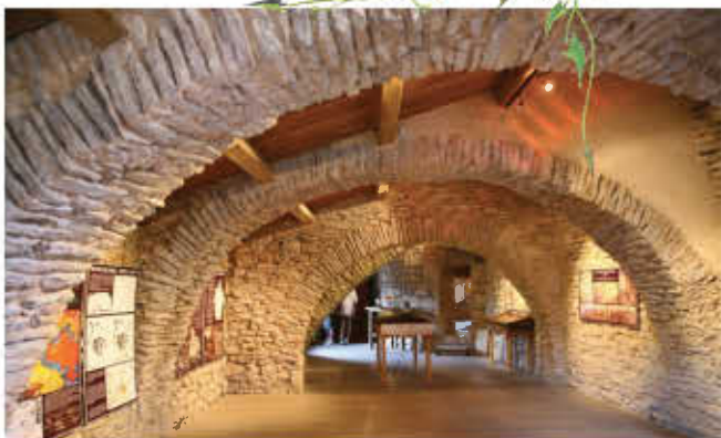
La maison de la Scipione