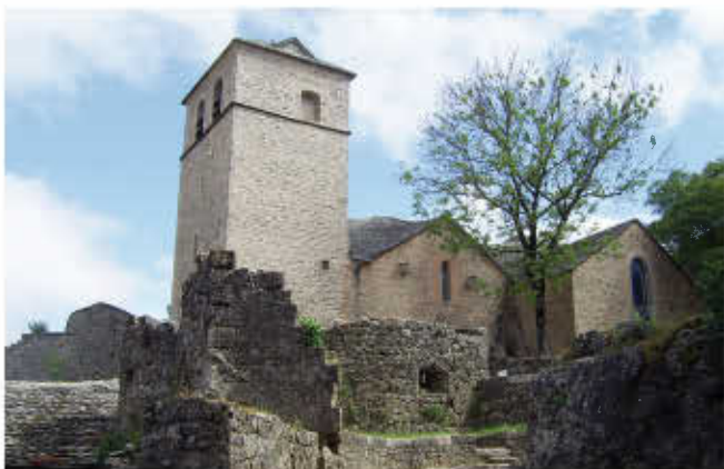
L'église Saint Christophe